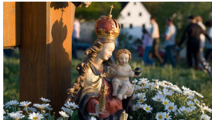
Markus Weinländer, Maiandacht, Pfarrbriefservice.de